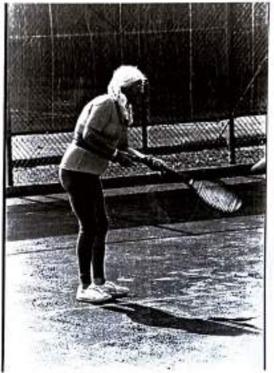
Jux as jux can