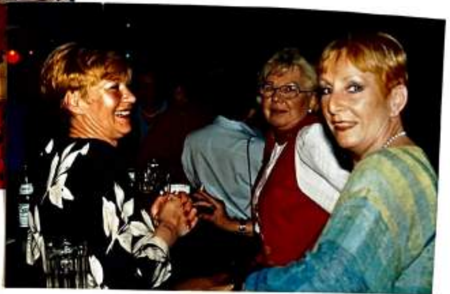
Bilder (v.l.n.r.): Venezianische Nacht 1993, Wandertag 1997, Valentinsfasching 1998, Tanz in den Mai 1998