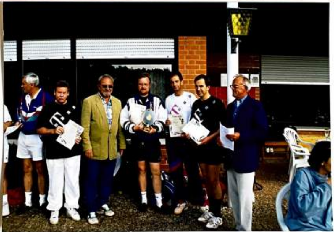
Bilder über gelebte Öffentlichkeitsarbeit (oben): Im Rahmen des Feriensportprogramms der Stadt verjüngten vorübergehend Kids den GTC (unten): 1. Göttinger Meisterschaft für Betriebe; Siegerehrung des Teams der Telekom